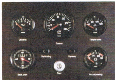
Afmeting: 210 mm. x 300 mm.